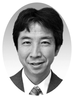
鷲見 宗重 議員

答 今後に必要な整備や安全対策は、指定管理者と調整・連携し計画的に進めてまいります。現役のまちづくりの推進や医療費の抑制にスポーツメニューの充実や指導者の育成を推進して市民の健康づくりに繋げていく取り組みを考えていきます。