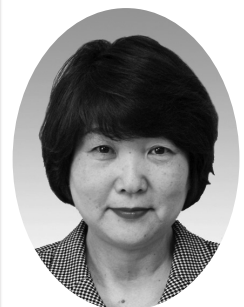
小野田由紀子 議員

今後、新たに高齢者の居場所として活動支援する施設や空間については、「健康自生地」として認定し、ホームページなどで、実施されるプログラムやメニューを情報発信していきます。来年度は、このような高齢者の居場所を市内に20箇所程度設置したいと考えています。